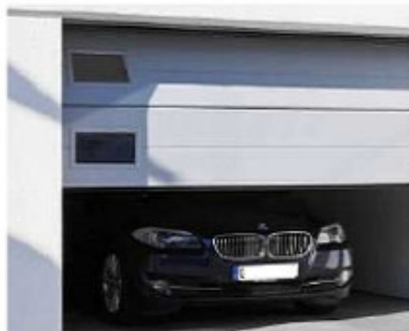
Sektionaltor Sonderfarben, hier mit Fenstern als Extra.

Die elegante Torlösung, schiebt sich senkrecht nach oben unter die Decke. Mit ISOLIERUNG, viele Farben und Designs lieferbar.