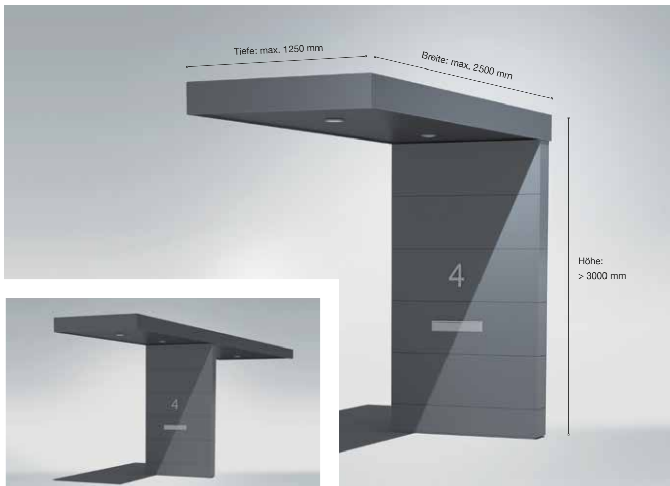
» S1-Eingangüberdachung in T-Form für 2 nebeneinanderliegende Eingänge