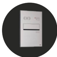
» Einbaubeleuchtung (optional)